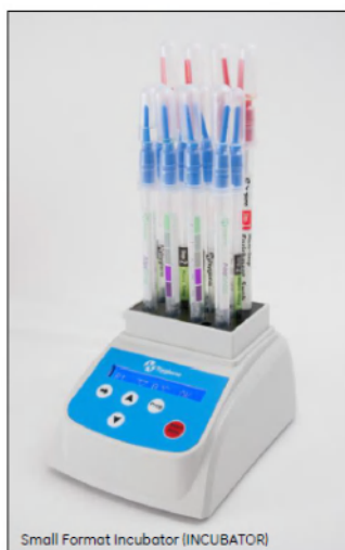
Small Format Incubator (INCUBATOR)